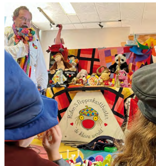
Kindermiddag met poppentheater

Het was vaak een geur- en kleurrijke bedoening bij de Inloop.