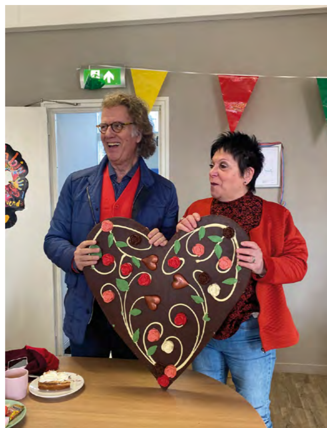
André Rieu overhandigt een van de chocoladeharten aan vrijwilliger José.

Een van de hoogtepunten van 2022, was het bezoek van André Rieu: bij bezocht voor het eerst onze Inloop en nam heerlijke chocoladeharten mee om chocolademousse van te maken. We kregen gelijk het aanbod om samen met hem deze lekkernij klaar te maken. Deze werden bij de volgende lunches aan de Members uitgeserveerd.