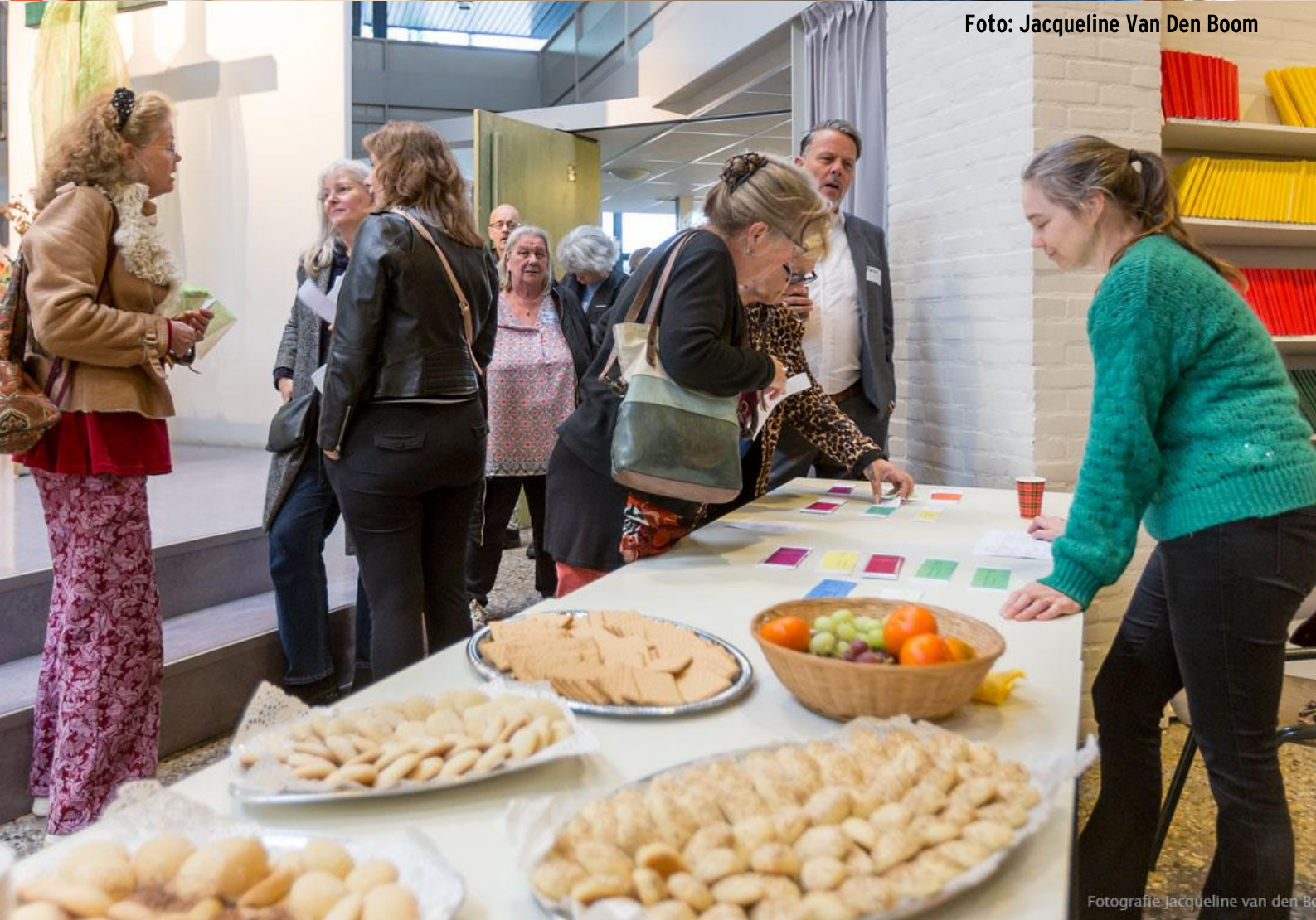
Fotografie Jacqueline van den Boom